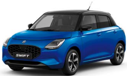
Zafírkék gyöngymetál × Ónixfekete gyöngyház