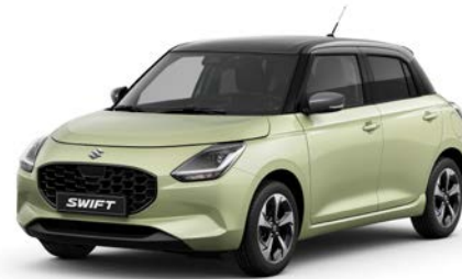
Gyöngysárga metál × Ásványszürke metál