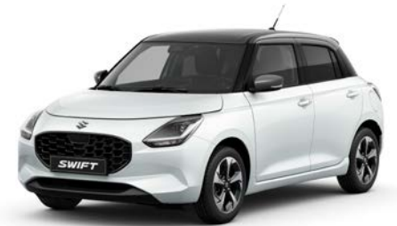
Gleccserfehér gyöngyház × Ásványszürke metál