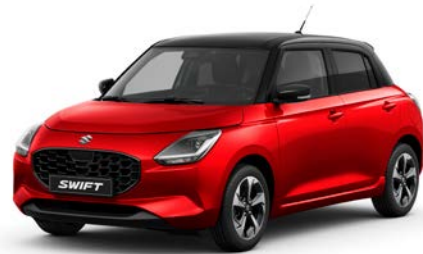
Lángvörös gyöngymetál × Ónixfekete gyöngyház