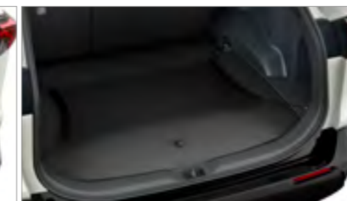
Csomagtérelválasztó háló – horizontális